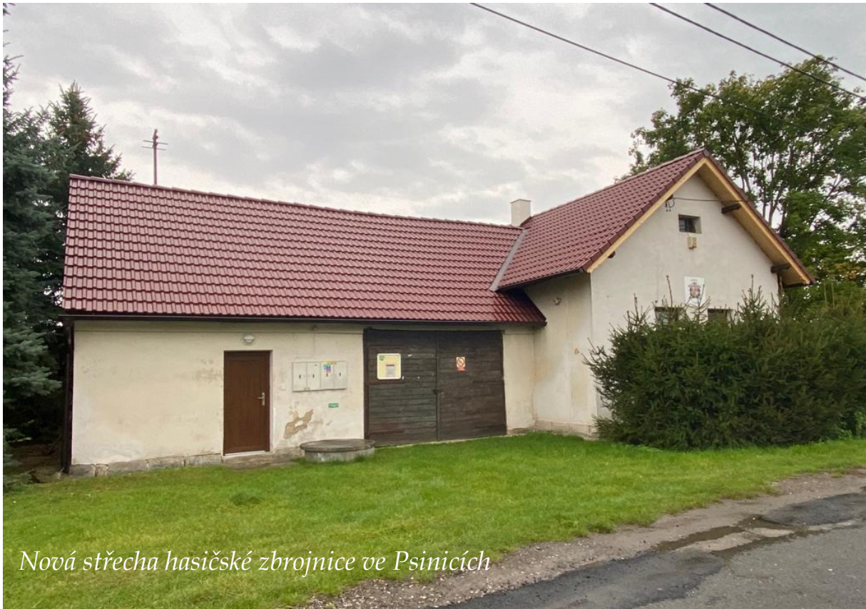
Nová střecha hasičské zbrojnice ve Psinicích

Rád bych tedy na tomto místě podal informaci o tom, co pro naše ob-