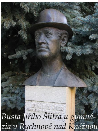
Busta Jiřího Šlitra u gymnázia v Rychnově nad Kněžnou

Jiří Šlitr byl vystudovaný právník, tomuto povolání se však nikdy nevěnoval. Snad i proto se mu také občas hezky přezdívalo Doktor klavír.